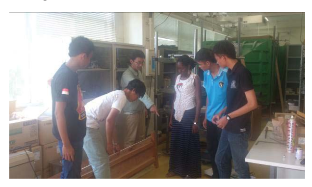
写真 1 機械工学実験Ⅲの作業風景

日本における学術的な研究も経験してもらうことを目的として、著者らの研究室で行っている毎週の報告会にも参加してもらった。図 2 における Laboratory meeting が該当し、毎週火曜日の 16:20 から実施してい