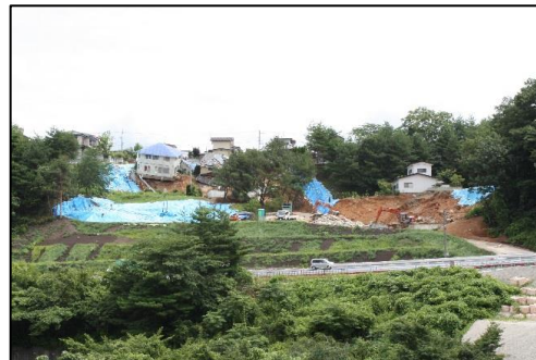
東北地方太平洋沖地震において被災した宅地(宮城県, 福島県)