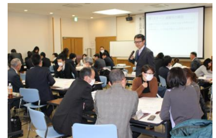
写真. 住民や学校教員向けのワークショップ